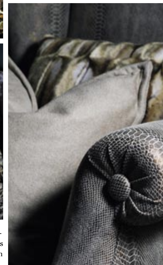
Fauteuil 'Seattle' van Marie's Corner, stof van Lizzo. Kussens van Etro en Loro Piana.